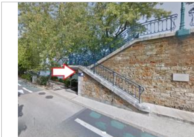
Plaque indiquant le niveau de la Marne lors de l'inondation de 1910