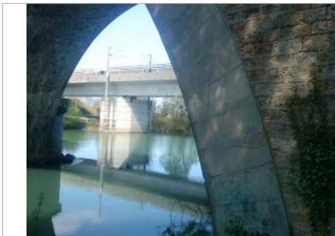
Pont SNCF près de l'écluse de Chalifert