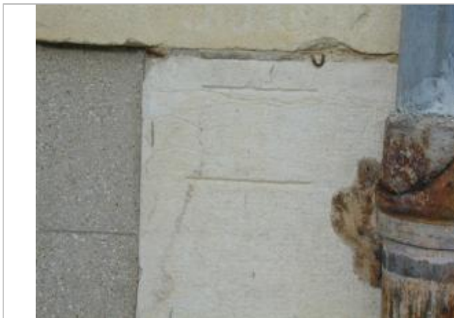
Repères de crue non datés