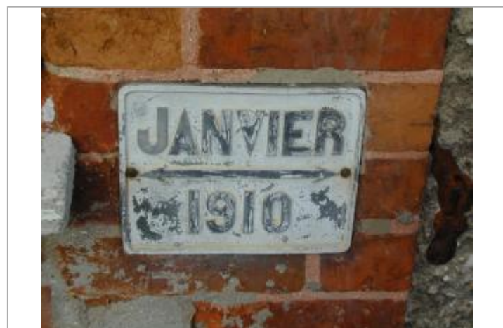
Repère de crue de 1910