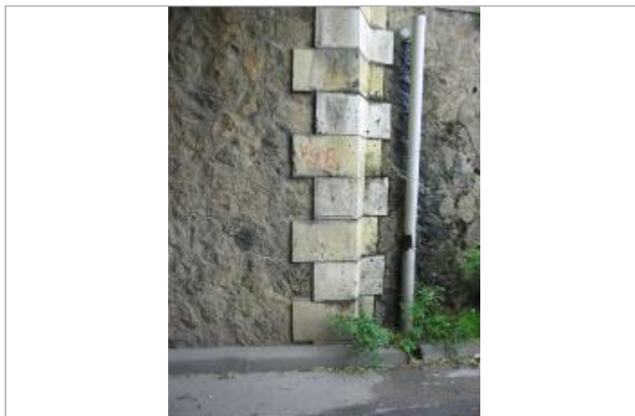
Pont SNCF, chemin du petit Noizy

Coordonnées WGS84 : X: 2.41523909 / Y: 48.70881440 Coordonnées RGF93 (Lambert 93) X: 656972.61 / Y: 6845567.66 Coordonnées RGF93 (ETRS89) : X: 2.4152391 / Y: 48.7088144 Code Hydro : ----0010 Rive de référence : Droite