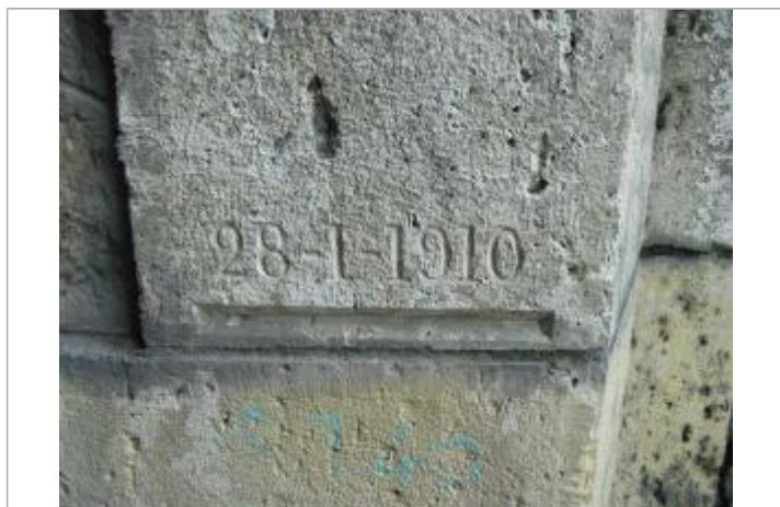
Repère de crue de 1910

Méthode : Non renseigné Organisme : DIREN Île-de-France Référence nivelée : Marque d'inondation Système altimétrique : NGF IGN 1969 (système normal)