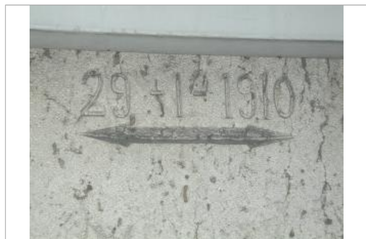
Repère de crue de 1910

GÉNÉRAL Code : DIREN_IDF_R_59_90 Date de mise à jour : 04/05/2026 Auteur : SPC SMYL