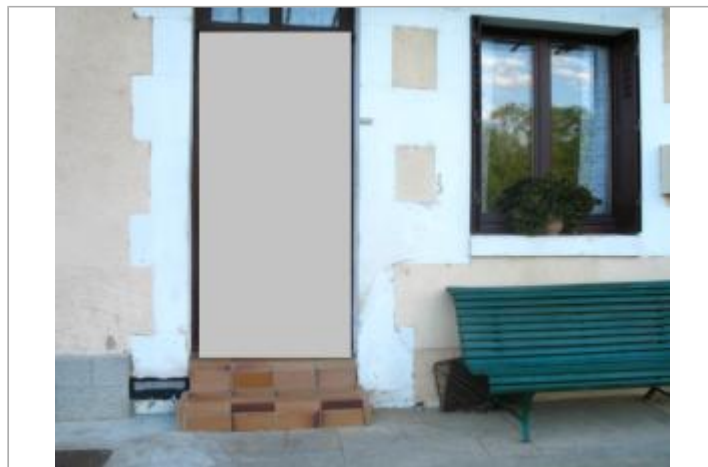
4 quai de l'Yonne

GÉOLOCALISATION Coordonnées WGS84 : X: 3.59077622 / Y: 47.75489980 Coordonnées RGF93 (Lambert 93) X: 744263.19 / Y: 6739555.24 Coordonnées RGF93 (ETRS89) : X: 3.5907762 / Y: 47.7548998 Code Hydro: F3--0200 Rive de référence: Gauche