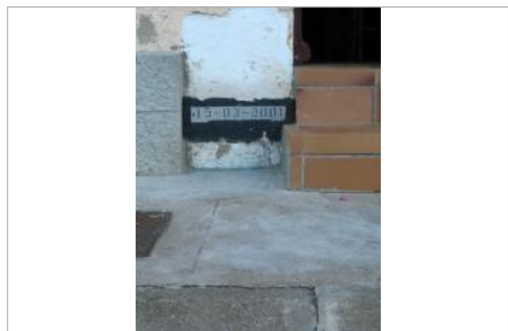
Repère de crue 2001

GÉNÉRAL Code : DIREN_IDF_R_51_74 Date de mise à jour : Auteur : SPC SMYL 28/01/2020