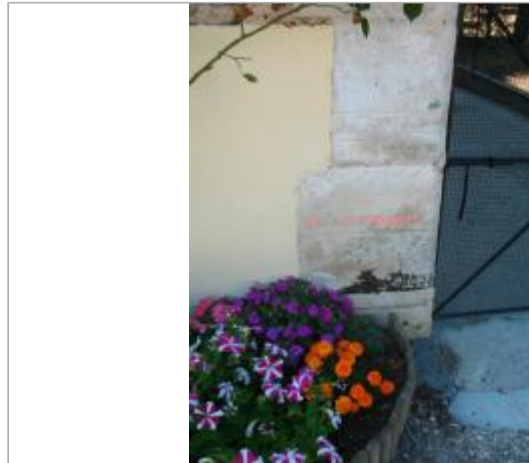
Maison éclusière de Vaux, n°78

Coordonnées WGS84 : X: 3.59489270 / Y: 47.75971200