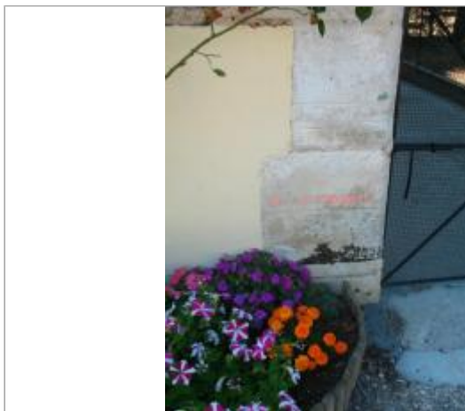
Maison éclusière de Vaux, n°78

Coordonnées WGS84 : X: 3.59489270 / Y: 47.75971200 Coordonnées RGF93 (Lambert 93) X: 744567.58 / Y: 6740092.2 Coordonnées RGF93 (ETRS89) : X: 3.5948927 / Y: 47.759712 Code Hydro: F3--0200 Rive de référence: