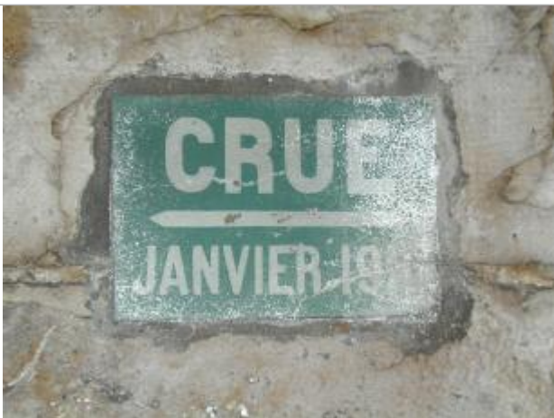
Repère de crue de 1910

Altitude calculée de l'eau (en m) : 34.31