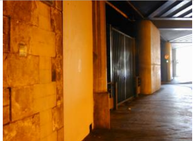
Rue de Rambouillet, sous le tunnel sous voies