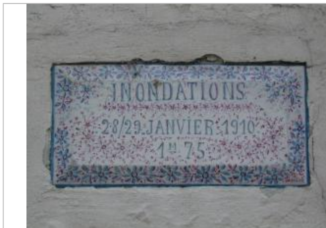
Repère de crue de 1910

Altitude calculée de l'eau (en m) : 34.31