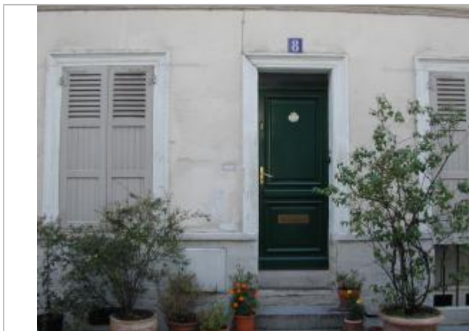
8 rue Crémieux

Coordonnées WGS84 : X: 2.37040396 / Y: 48.84653530