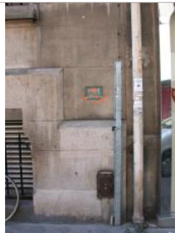
57 rue Traversière

Coordonnées WGS84 : X: 2.37425740 / Y: 48.84865530