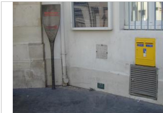
Hôpital des quinze-vingt