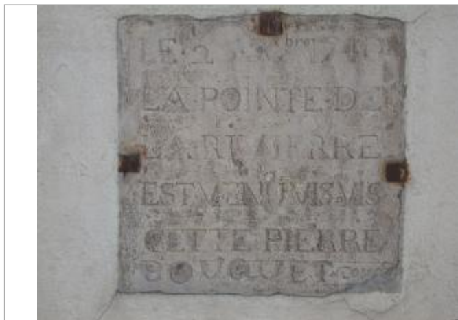
Repère de crue 1740