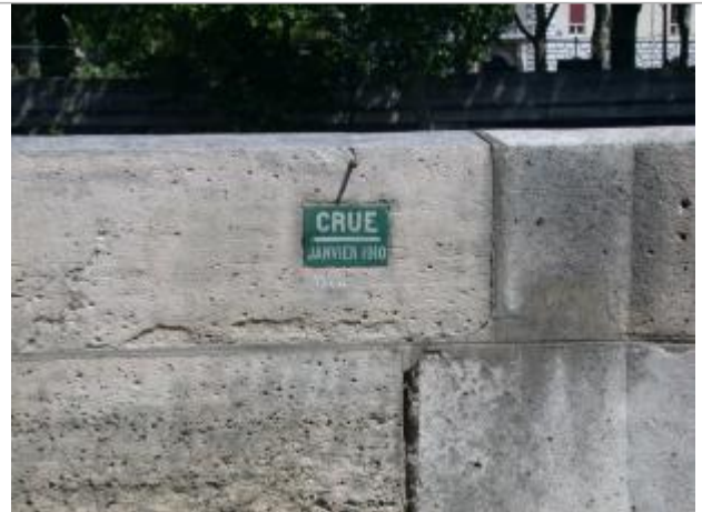
En face du 1 quai d'Anjou

Coordonnées WGS84 : X: 2.36012788 / Y: 48.85104050