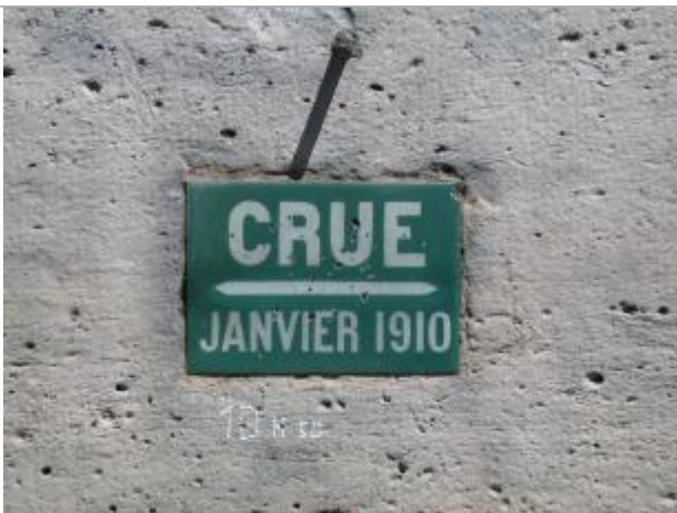
Repère de crue de 1910

Altitude calculée de l'eau (en m) : 34.44