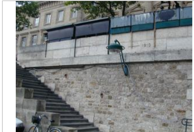
Quai Conti, au niveau de l'Hôtel de la monnaie, en amont des sapeurs pompiers - auteur photo : DIREN IDF

Coordonnées WGS84 : X: 2.33937987 / Y: 48.85681090