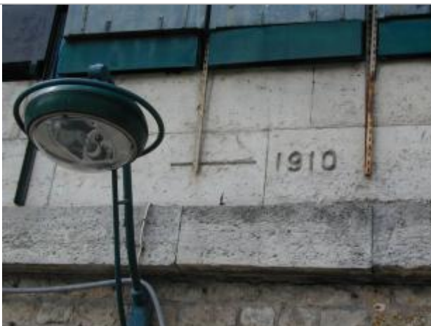
Repère de crue de 1910

Altitude calculée de l'eau (en m) : 34.62