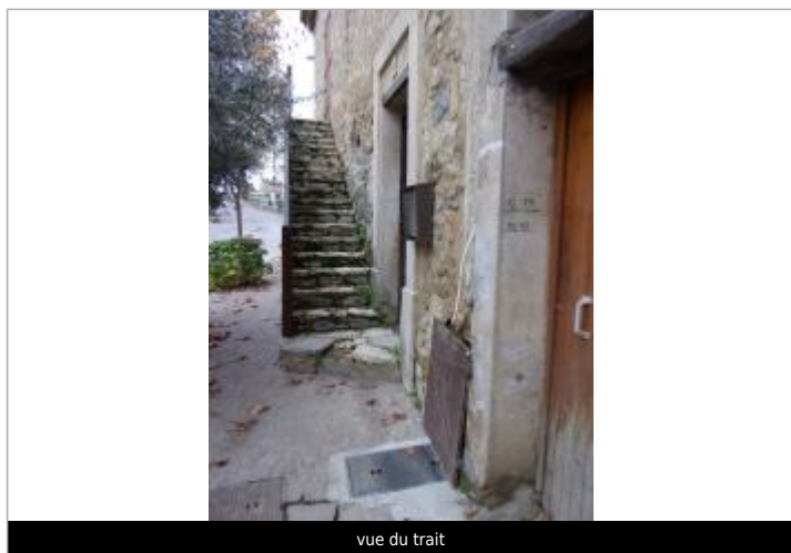
vue du trait

Texte : 10/2018 Maximum de l'inondation : Oui Visibilité : Oui État du repère : Bon Pérennité : Moyenne