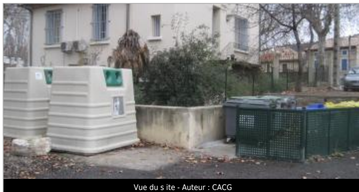
Vue du site - Auteur : CACG