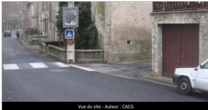
Vue du site - Auteur : CACG

Coordonnées WGS84 : X: 2.87180850 / Y: 43.31687100