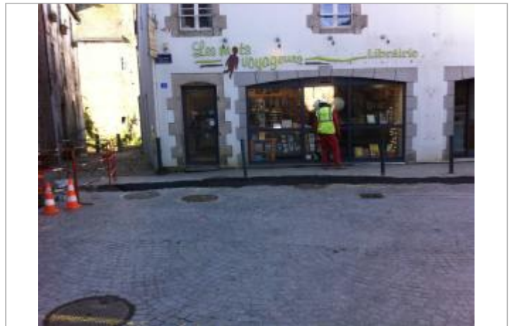
vue d'ensemble de la librairie à l'angle de la place Hervo et de la rue Saint-Guerloes