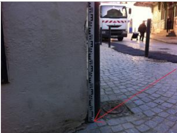
Sol au droit de la gouttière / angle du bâtiment

Altitude calculée de l'eau (en m) : 4.99 m