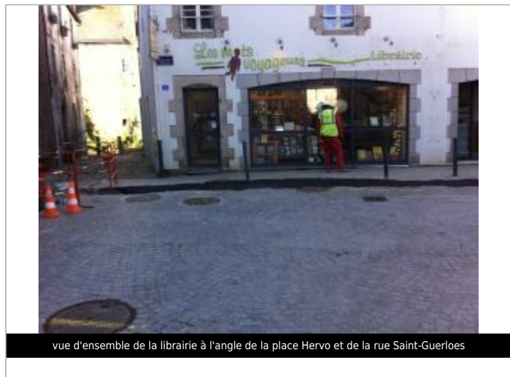
vue d'ensemble de la librairie à l'angle de la place Hervo et de la rue Saint-Guerloes