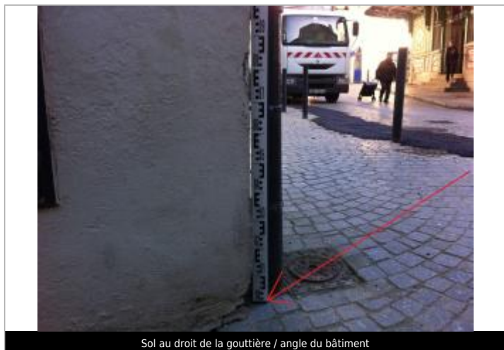
Sol au droit de la gouttière / angle du bâtiment

Maximum de l'inondation : Non PHEC : Non Repère calculé : Non