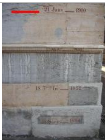
photo du repère

Altitude calculée de l'eau (en m) : 245.56 m