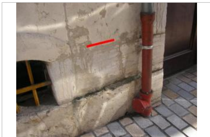
photo du repère

Altitude calculée de l'eau (en m) : 244.39