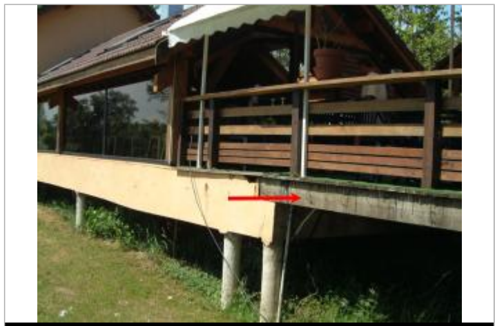
photo du repère

GÉNÉRAL Code : EPTBD_R_115_1 Date de mise à jour : 02/05/2024 Auteur : EPTB Saône et Doubs