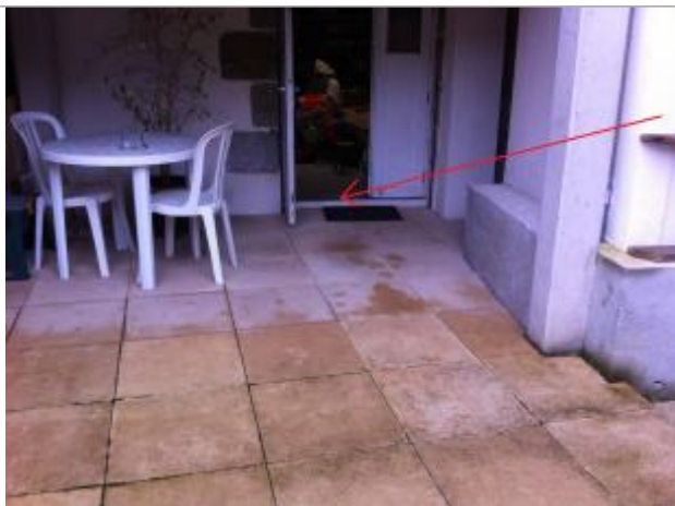
seuil de la porte de la cave (limite atteinte par l'inondation)

Altitude calculée de l'eau (en m) : 4.72