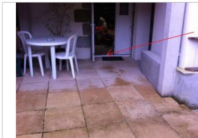
seuil de la porte de la cave (limite atteinte par l'inondation)

Altitude calculée de l'eau (en m) : 4.72