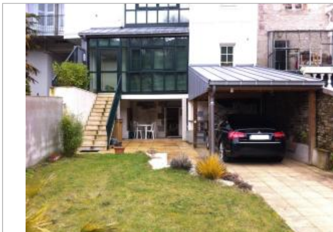
vue d'ensemble à l'arrière du bâtiment