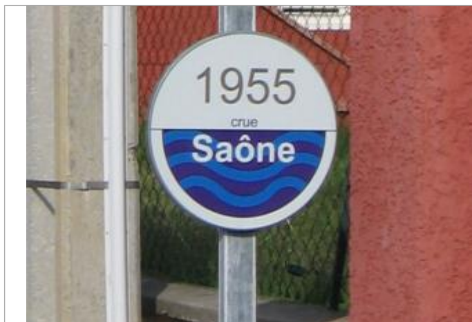
Photo du repère

Altitude calculée de l'eau (en m) : 170.1 m