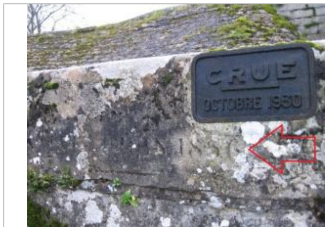
Photo du repère