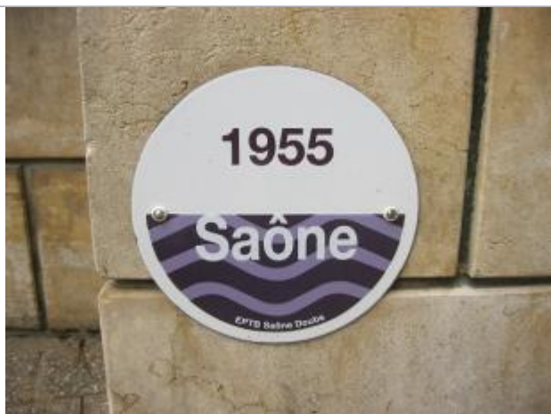
Photo du repère

Altitude calculée de l'eau (en m) : 172.42