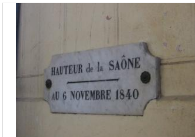
Photo du repère

Altitude calculée de l'eau (en m) : 175.3