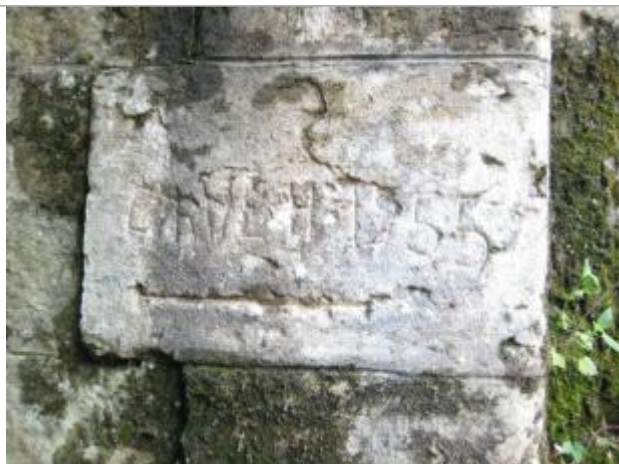
photo du repère

Altitude calculée de l'eau (en m) : 175.68