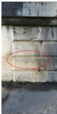
Vue du repère

Altitude calculée de l'eau (en m) : 310.6 m