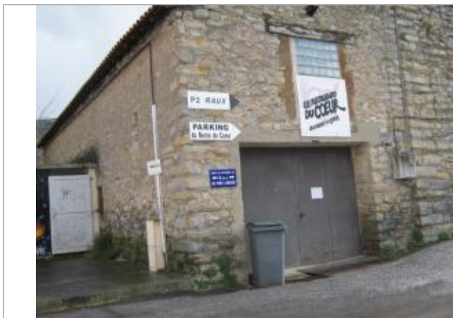
Photo du recensement d'origine, auteur photo : SPC Garonne Tarn Lot

Coordonnées WGS84 : X: 3.08611000 / Y: 44.09580000