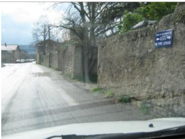
Photo du recensement d'origine, auteur photo : SPC Garonne Tarn Lot

Différence entre le niveau d'eau et la référence (en m) : 1.550 m