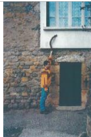
Photo du recensement d'origine, auteur photo : SPC Garonne Tarn Lot