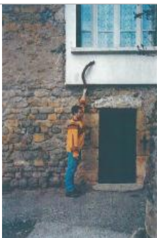
Photo du recensement d'origine, auteur photo : SPC Garonne Tarn Lot