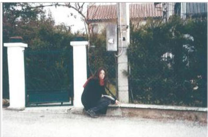
Photo du recensement d'origine, auteur photo : SPC Garonne Tarn Lot