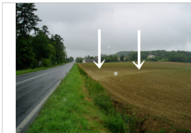
Vue opposée à Pavie. En amont immédiat de la D 929, la crue a déposé une laisse nette.

Code : GTL_R_8393 Date de mise à jour : 24/04/2018