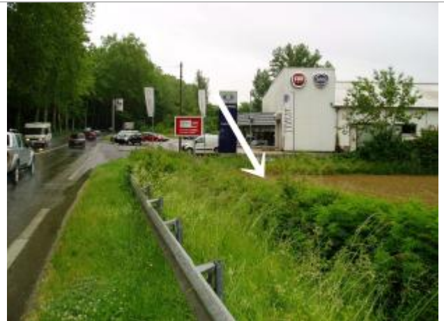
Vue vers l'aval. A quelques mètres de la route la crue a déposé une laisse.

Coordonnées WGS84 : X: 0.57748000 / Y: 43.62170000