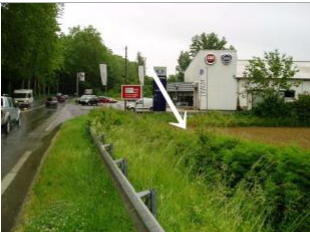
Vue vers l'aval. A quelques mètres de la route la crue a déposé une laisse.

Système altimétrique : NGF IGN 1969 (système normal)