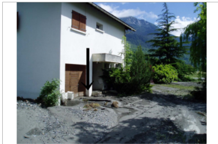
Trace de la crue

GÉOLOCALISATION Coordonnées WGS84 : X: 0.33282900 / Y: 42.82870000 Coordonnées RGF93 (Lambert 93) : X: 481720.09 / Y: 6195821.93 Coordonnées RGF93 (ETRS89) : X: 0.332829 / Y: 42.8287 Code Hydro: 00130550 Rive de référence: