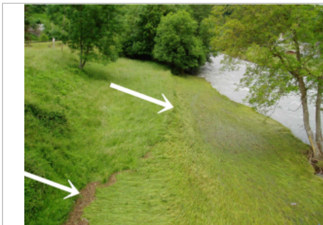
Laisses végétales d'inondation