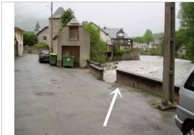
Débris montrant que la crue a frôlé à cet endroit le seuil de débordement