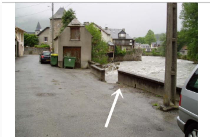
Débris montrant que la crue a frôlé à cet endroit le seuil de débordement

Système altimétrique : NGF IGN 1969 (système normal)