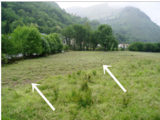
L'herbe couchée témoignant de l'extension maximale de la crue

Système altimétrique : NGF IGN 1969 (système normal)