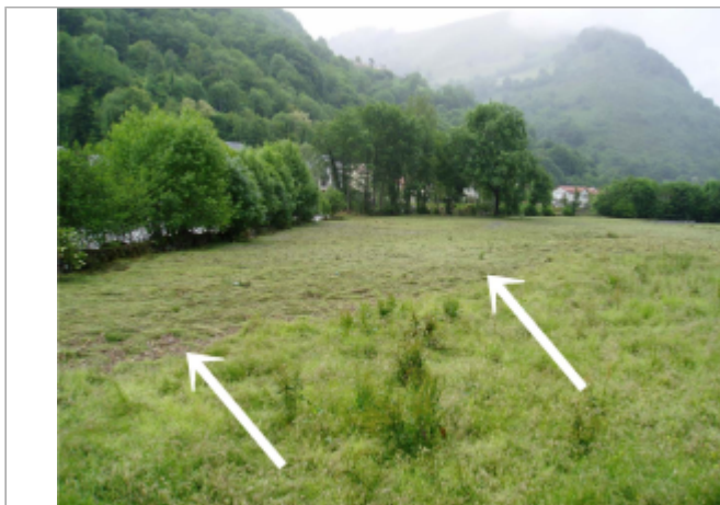
L'herbe couchée témoignant de l'extension maximale de la crue

Coordonnées WGS84 : X: 0.37751700 / Y: 42.96790000