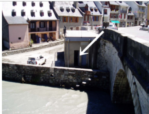
Trace de la crue à l'intérieur des toilettes

Coordonnées WGS84 : X: 0.35742500 / Y: 42.90600000