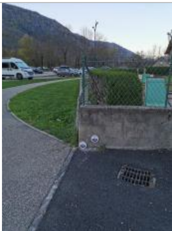
Repère normalisé. 2022