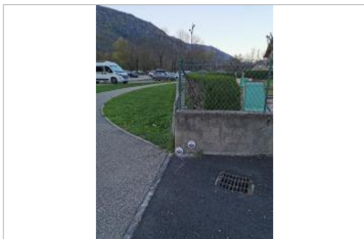
Repère normalisé. 2022

Code : GTL_R_8295 Date de mise à jour : 26/10/2023 Auteur : SPC GTL