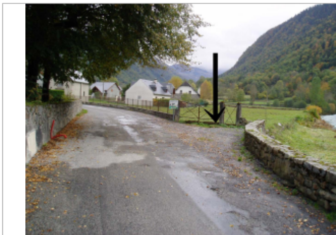
Débris dans le grillage

Coordonnées WGS84 : X: 0.39683700 / Y: 42.87060000