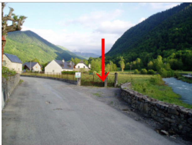
Débris dans le grillage

Différence entre le niveau d'eau et la référence (en m) : 0.580 m