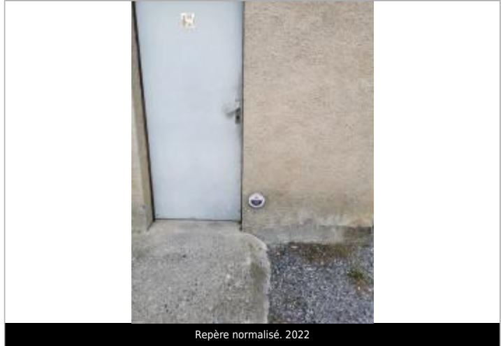
Repère normalisé. 2022

GÉNÉRAL Code : GTL_R_8281 Date de mise à jour : 26/10/2023 Auteur : SPC GTL