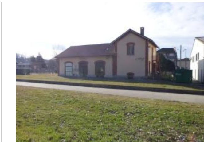
Ancienne gare