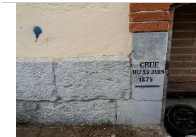
repère restaurée en 2022

Altitude calculée de l'eau (en m) : 292.56 m