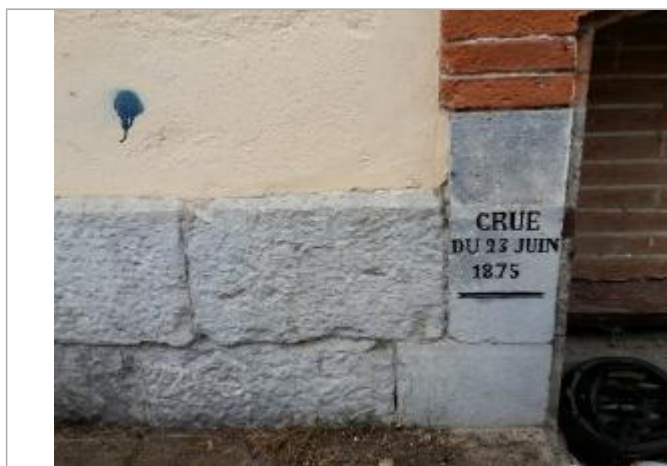
repère restaurée en 2022

Altitude calculée de l'eau (en m) : 292.56 m