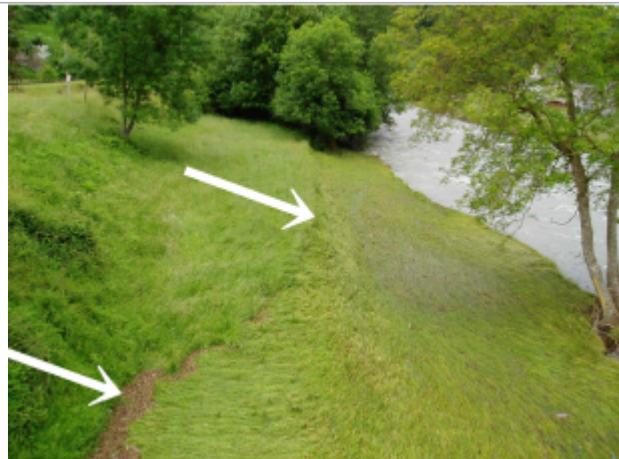
Laisses végétales d'inondation