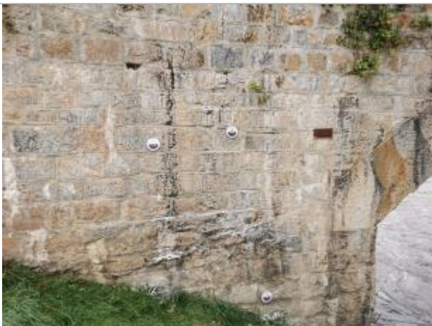
Repère normalisé. 2022

Système altimétrique : NGF IGN 1969 (système normal)