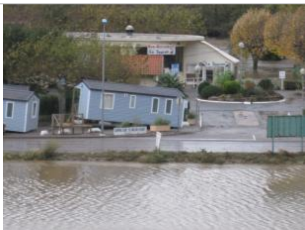
Photo du recensement d'origine.

Système altimétrique : NGF IGN 1969 (système normal)