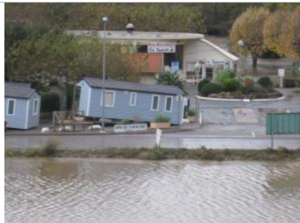
Photo du recensement d'origine.