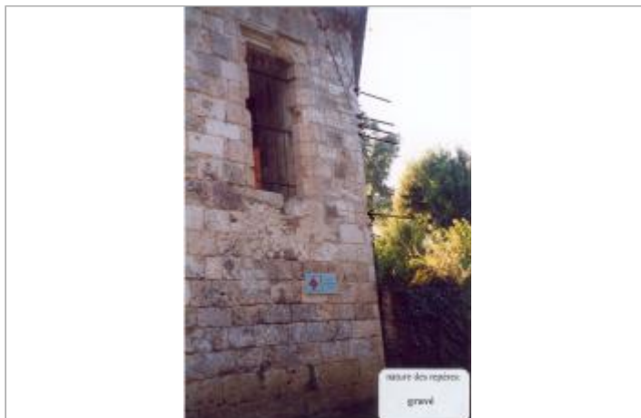
Photo des repères

Coordonnées WGS84 : X: 0.34134516 / Y: 44.13318700