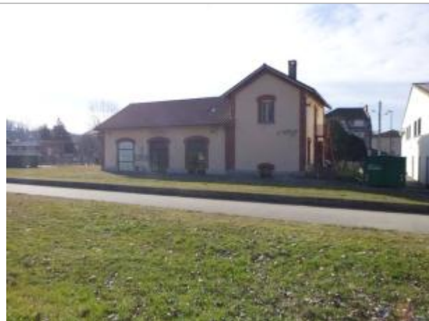
Ancienne gare

Coordonnées WGS84 : X: 0.96170600 / Y: 43.10171500