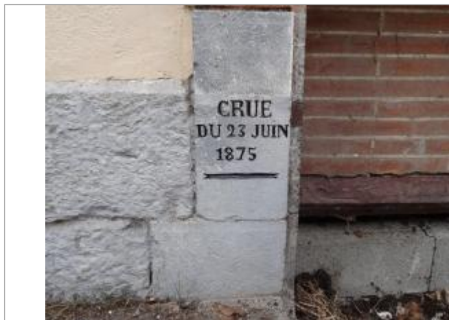
Marque gravée © Syndicat Rivières Salat Volp

Altitude calculée de l'eau (en m) : 293.35 m