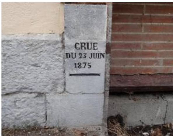
Marque gravée © Syndicat Rivières Salat Volp

Altitude calculée de l'eau (en m) : 293.35 m