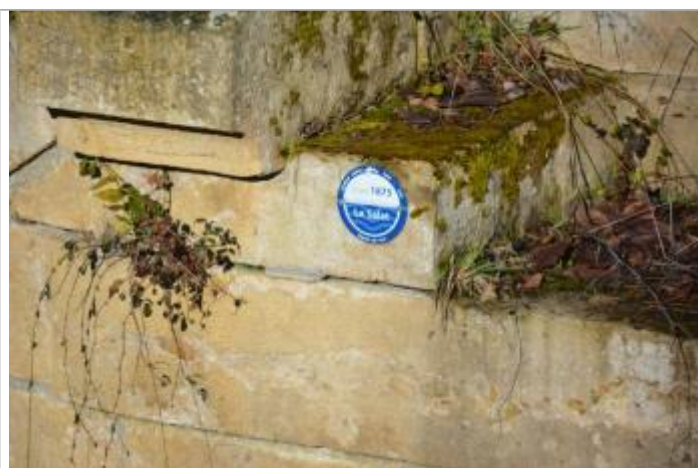
Macaron Repère

Altitude calculée de l'eau (en m) : 319.46 m