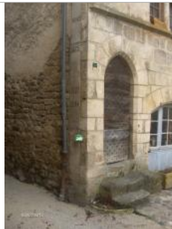
Photo du recensement d'origine, auteur photo : SPC Garonne Tarn Lot